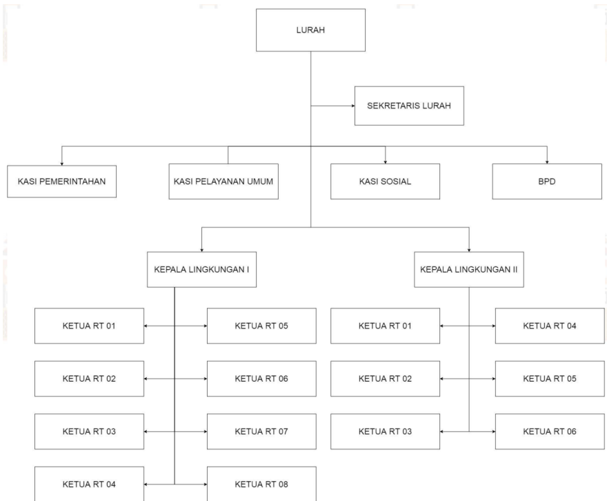
Gambar 2.1 Struktur Organisasi Kelurahan Korpri Jaya, 2023